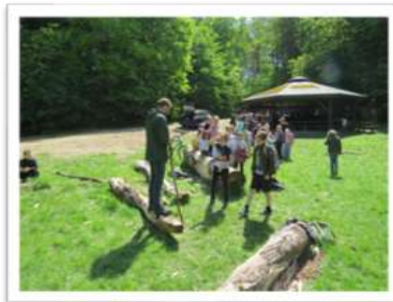
Elever fra Houlkærskolen på tur til Granada

Det betinger dog, at stierne etableres fra starten, så de er klar, når de første byboere flytter ind i området. Det skal sikres, at der fra området er stiforbindelser til både Overlundstien mod Lysningen samt til stierne langs Skaldehøjvej, mod Houlkærskolen.