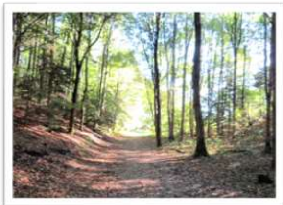
Natur i området

Stk. 3. Der skal ved lovens administration lægges vægt på den betydning, som et areal på grund af sin beliggenhed kan have for almenheden.